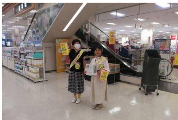
黄色いレシートキャンペーン