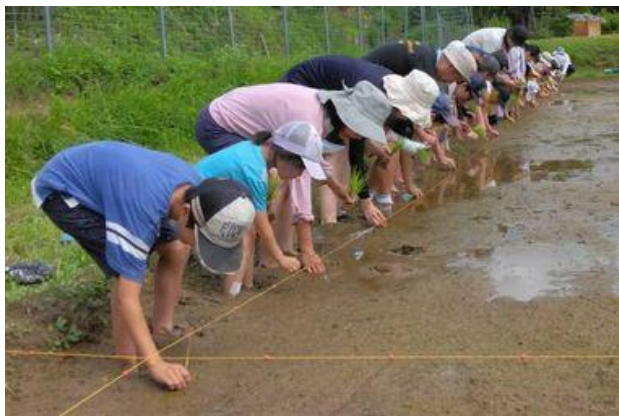
休耕田復元プロジェクト