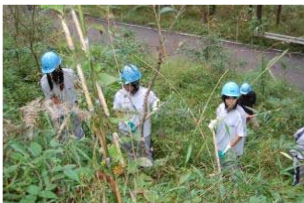
高校生との森づくり（GOCANの森）