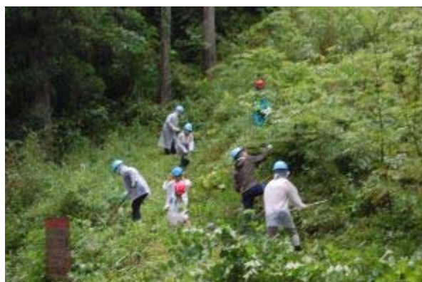
夏の下草刈り（GOCANの森）