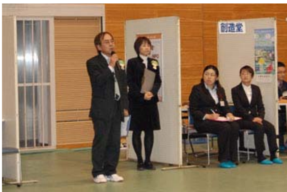
協働商談会（協働創出市2010）

旧西門川小学校松瀬分校（森の学舎）の有効活用として、環境文庫と体験型環境学習（川をたのしく親しもう）、水道管修理の資材費として、事業費321,445円に対して、20万円の助成を受けました。