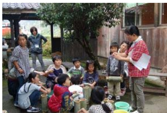
ドングリポットづくり