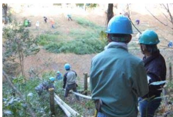
ローソンとの竹林整備（仮称妖精の森）