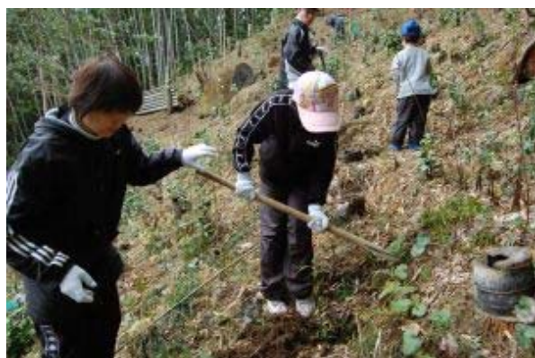
仮称妖精の森での補植樹