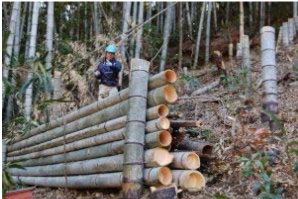
仮称妖精の森での竹棚づくり