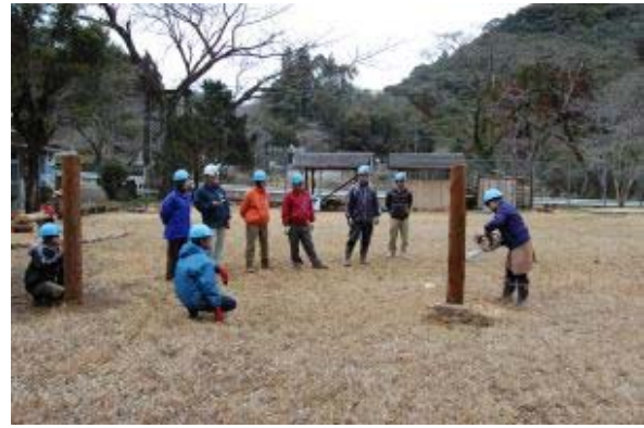
環境森林セミナー