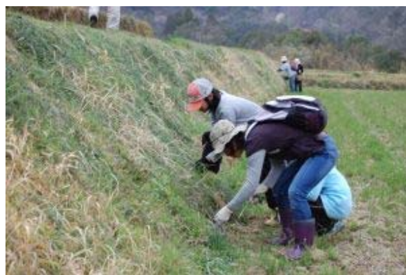
山菜の収穫（春を楽しもう）