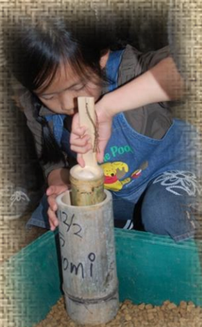
どんぐりの 苗床作り 2018年12月